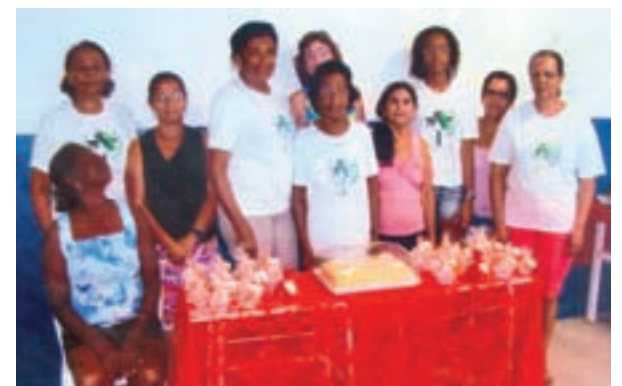
Grupo de líderes na festa do Dia das Mães na comunidade Nossa Senhora de Fátima.