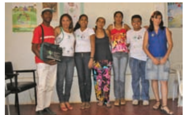
Encontro de comunicadores.

Colaboração: Equipe de comunicação da Diocese de Irecê