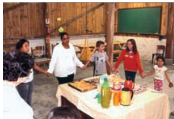
Encontro especial para gestantes.

Apesar de tratar sobre assuntos relacionados às mães e seus recém-