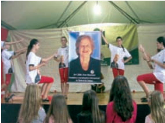
Festa para celebrar os 25 anos da Pastoral da Criança.

Abrangência: A Pastoral da Criança da Diocese de Criciúma, em 2010, atua em 25 Municípios do Sul Catarinense. Tem como voluntários: 10 Coordenadores e Vice-coordenadores de Área; 31 Coordenadores Paroquiais; 298 Coordenadores Comunitários e 839 Líderes Comunitárias, capacitadas e atuantes, além de outros 407 voluntários. Nosso Setor desenvolve o programa da Pastoral da Criança em 30 paróquias, com