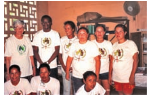
Líderes do Setor Tefé: trabalho com amor.

Não poderemos deixar de agradecer aos padres de nossa paróquia, pois foi junto com eles que lutamos para amenizar um pouco das carências que nos deparamos em nossa