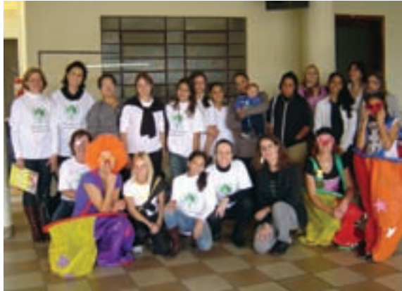
Líderes festejam a 1ª Celebração da Vida.

O Setor Noroeste se alegra em partilhar com todos que mais uma comunidade começou a contar com a presença e a atuação da Pastoral da Criança. Novos líderes foram capacitados e no dia 15 de maio aconteceu a primeira Celebração da Vida no bairro de Santa Felicidade, em Curitiba. Líderes, mães, crianças e brincadores se reuniram em uma tarde festiva para comemorar mais essa vitória da vida. Os líderes agora estão se empenhando para intensificar as visitas domiciliares e o trabalho com as gestantes.